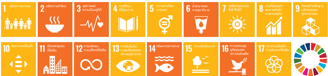
แผนภาพที่ 2: ผลการประเมินสถานะของเป้าหมาย SDGs

ผลการประเมินเป้าหมายการพัฒนาที่ยั่งยืนบ่งชี้ให้เห็นว่า ประเทศไทยมีความก้าวหน้าในหลากหลายประเด็น โดยในมิติการพัฒนาคคน (People) ภาครัฐและภาคส่วนที่เกี่ยวข้องได้ดำเนินมาตรการต่าง ๆ เพื่อพัฒนาคคนทุกช่วงวัย รวมทั้งมุ่งขจัดปัญหาความยากจนอย่างจริงจัง สะท้อนให้เห็นความก้าวหน้าในการขับเคลื่อนเป้าหมายที่ 1 ขจัดความยากจน เป้าหมายที่ 4 การศึกษาที่มีคุณภาพและเป้าหมายที่ 5 ความเท่าเทียมทางเพศ ในมิติเศรษฐกิจและความมั่งคั่ง (Prosperity) ประเทศไทยมีความก้าวหน้าในการขับเคลื่อนเป้าหมายที่ 7 พลังงานสะอาดที่เข้าถึงได้ เป้าหมายที่ 8 งานที่มีคุณค่าและการเติบโตทางเศรษฐกิจ เป้าหมายที่ 9 โครงสร้างพื้นฐาน นวัตกรรม และอุตสาหกรรม และเป้าหมายที่ 10 ลดความเหลื่อมล้ำ อันเป็นผลมาจากการดำเนินการสร้างเสถียรภาพทางเศรษฐกิจในระยะที่ผ่านมาประกอบกับการลงทุนทางโครงสร้างพื้นฐาน การวิจัยและพัฒนา เทคโนโลยี และนวัตกรรมต่าง ๆ รวมไปถึงการดำเนินการเพื่อลดความเหลื่อมล้ำในสังคมไทย ในมิติสิ่งแวดล้อม (Planet) มีความก้าวหน้าสำคัญในการขับเคลื่อนเป้าหมายที่ 13 การรับมือกับการเปลี่ยนแปลงสภาพภูมิอากาศ โดยได้ดำเนินการเชิงรุกเพื่อเตรียมความพร้อมรับมือกับความเสียหายจากการเปลี่ยนแปลงที่อาจเกิดขึ้น รวมถึงการวางแผนรับมือกับภัยพิบัติในรูปแบบต่าง ๆ นอกจากนี้ ในมิติความเป็นหุ้นส่วนการพัฒนา (Partnership) มีความก้าวหน้าในการขับเคลื่อนเป้าหมายที่ 17 ความร่วมมือเพื่อการพัฒนาที่ยั่งยืน เป็นอย่างมาก โดยประเทศไทยมี