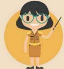
ข้าราชการครูและบุคลากร ทางการศึกษา