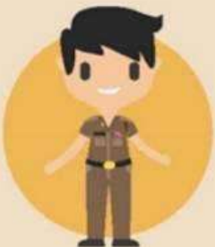
ข้าราชการตำรวจ