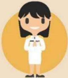
ข้าราชการพลเรือนสามัญ