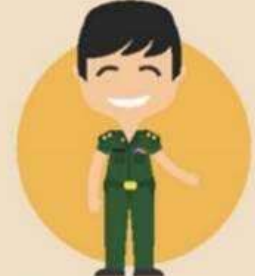
ข้าราชการทหาร และข้าราชการพลเรือนกลาโหม