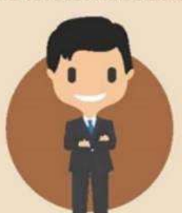
ข้าราชการการเมือง ซึ่งมิใช่คณะรัฐมนตรี