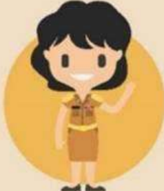
พนักงาน ส่วนท้องถิ่น