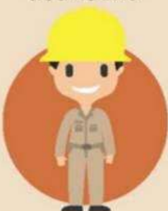
พนักงานรัฐวิสาหกิจ / องค์การมหาชน