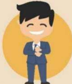
ข้าราชการพลเรือน ในสถาบันอุดมศึกษา