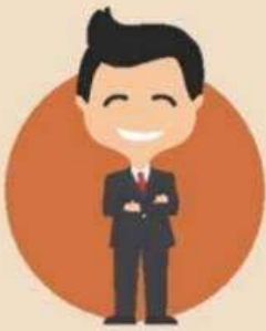
ผู้ปฏิบัติงานอื่นในหน่วยงาน ของรัฐในกำกับฝ่ายบริหาร